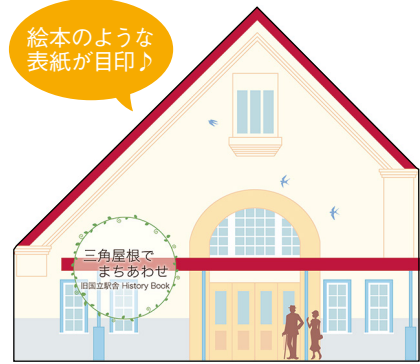
▲「三角屋根でまちあわせ旧国立駅舎History Book(歴史本)」。駅舎のような表紙が目印です。

市役所(3階) 国立駅周辺整備課、1階 情報公開コーナー、北市民プラザ(北3-1-1) 9号棟、南市民プラザ(泉2-1-3-2) 1号棟、国立駅前くにたち・こくぶんじ市民プラザ(北1-14-1)、公民館(中1-15-1)、中央図書館(富士見台2-34)、市民芸術小ホール(富士見台2-48-1)、郷土