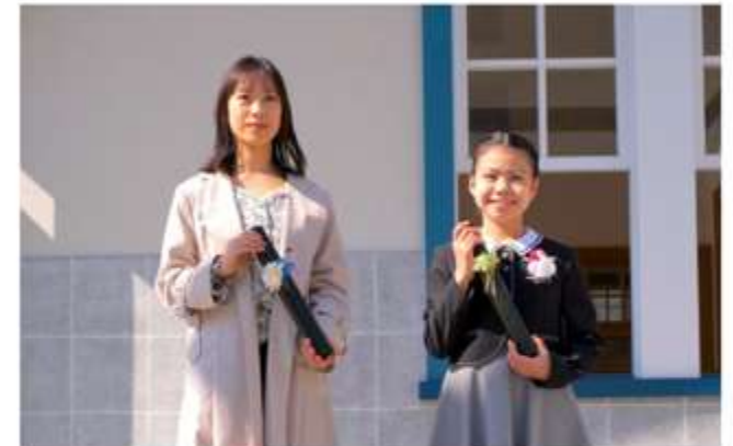
卒業生を対象とした写真撮影会「Go Next, 卒業生!!」