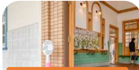
展開中の様子から