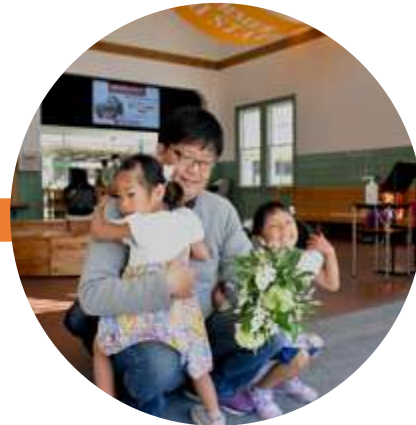
展開中の様子から