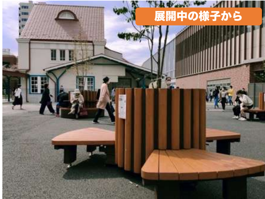
展開中の様子から