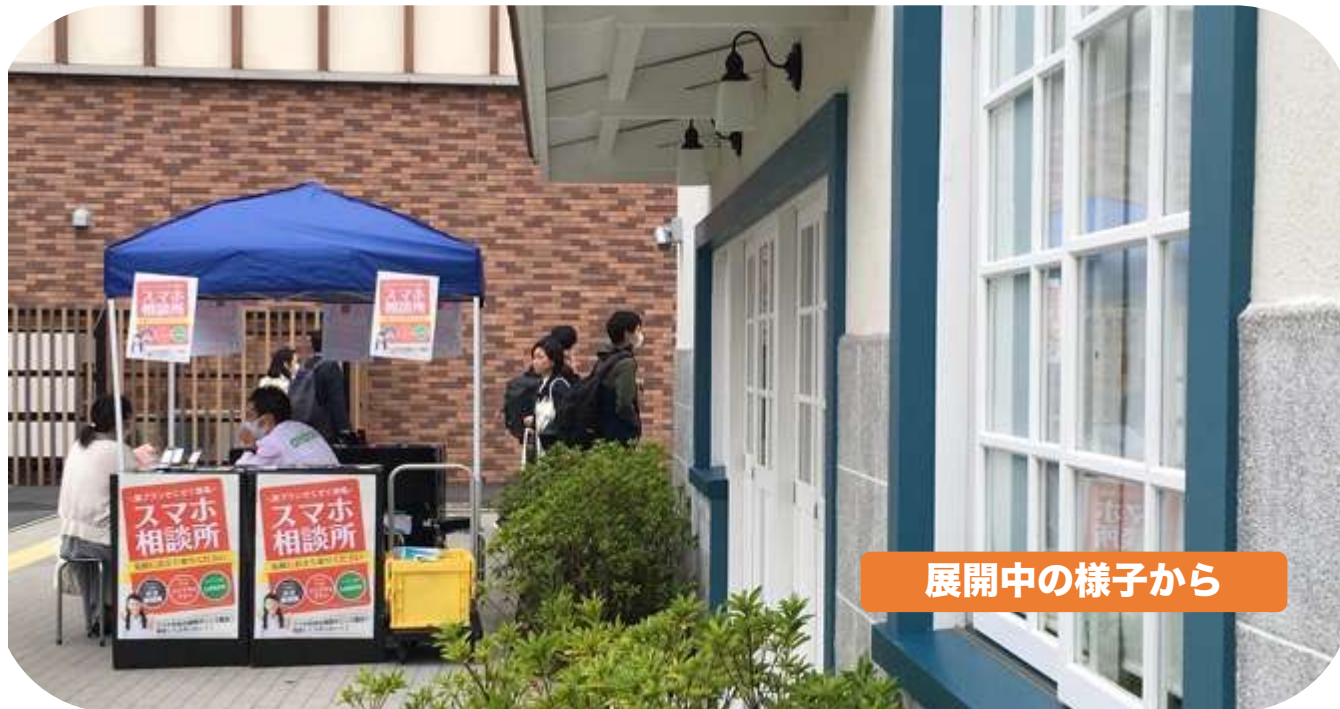
展開中の様子から

スペース) 屋外スペース「デッキ1」 会 期) 2021. 3. 20 (土曜日) ~ 3.28 (日曜日) 主 催) ソフトバンク国立