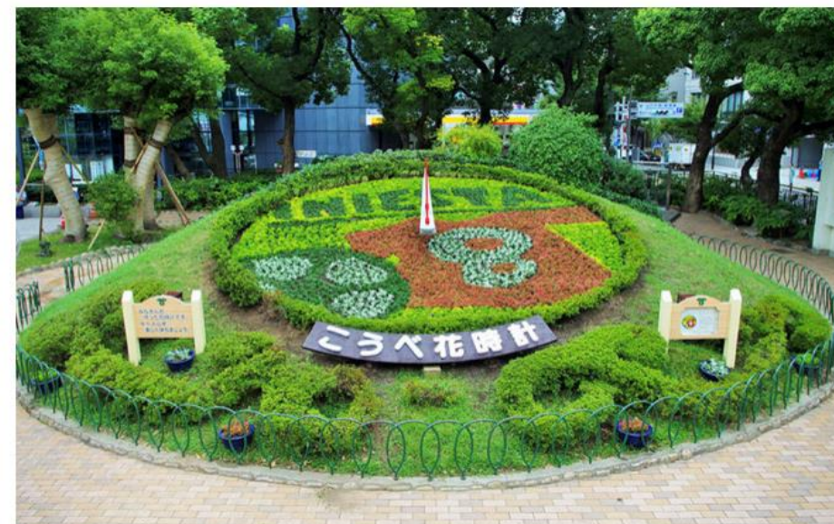
完成したイニエスタ版「こうべ花時計」（6日・神戸市内）