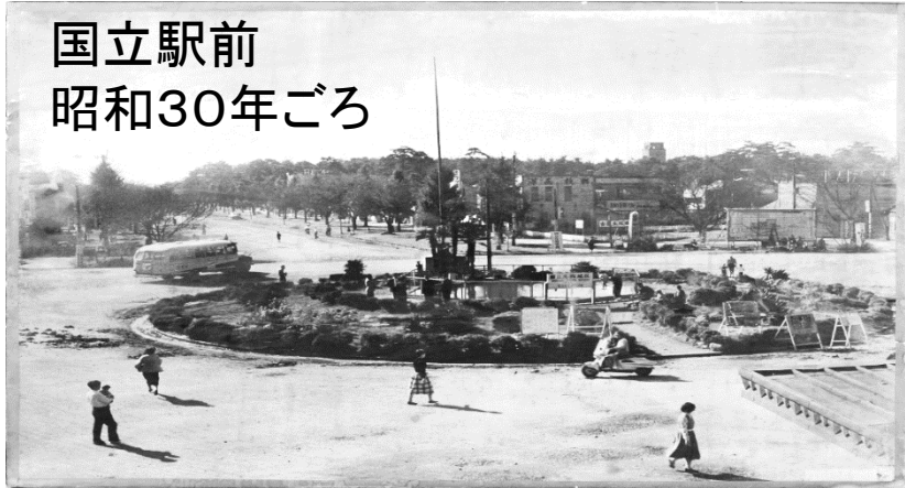
国立駅前 昭和30年ごろ