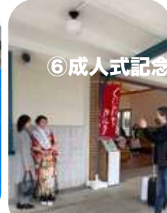
⑥成人式記念撮影サービス