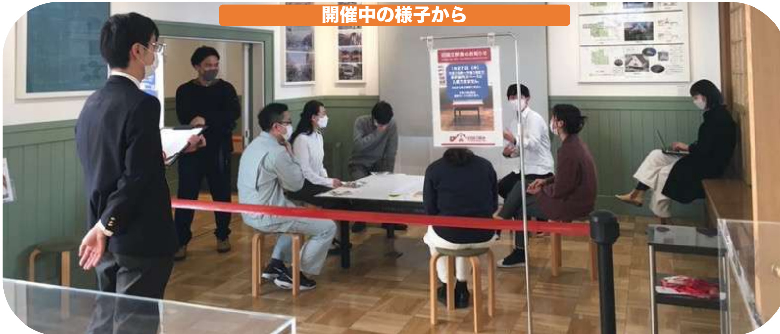
開催中の様子から

スペース) 展示室 会 期) 1月27日 (木) 午前10時～午後1時まで 主 催) 国立市 市長室 (国立市教育委員会 生涯学習課)