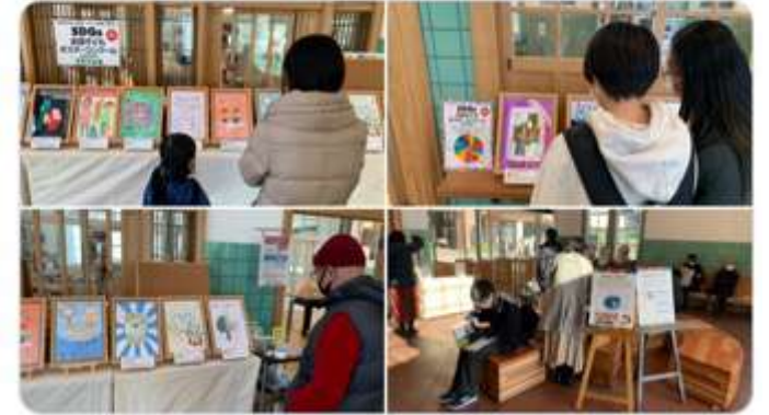
開催中の様子から

子ども大学くにたち @cu_kunitachi · 2021年12月24日 第2回SDGs全国子どもポスターコンクール国立市特別募集 受賞作品展 開催！ 12/24~1/9@旧国立駅舎 小中学生が描いたSDGsポスターをぜひご覧ください！