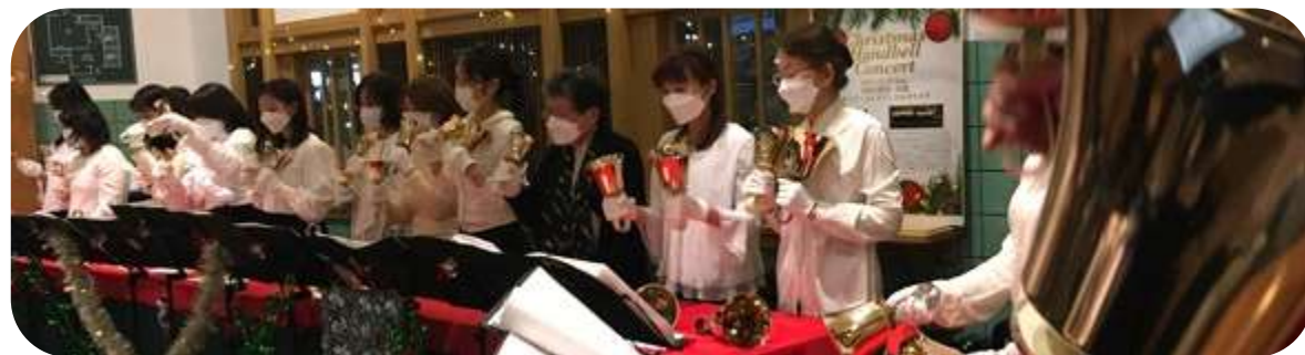
開催中の様子から