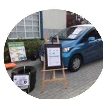
キタジマ商事さん