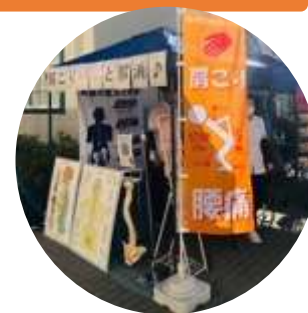
やすらぎカイロプラクティック