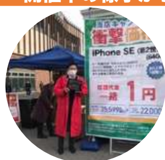
ソフトバンク国立さん