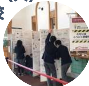
学校帰りの生徒さんが、先生たちの展示準備作業を応援も。

スペース) 広間 会 期) 2月10日 (木) ~15日 (火) 主 催) 国立市立 国立第一中学校