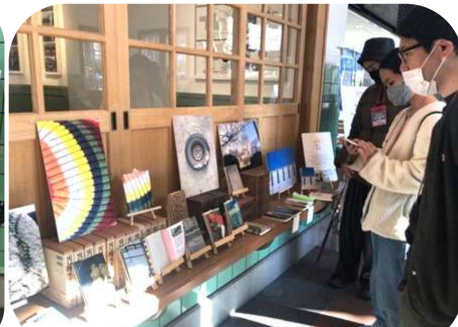
開催中の様子から