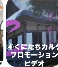
④くにたちカルタ プロモーション ビデオ