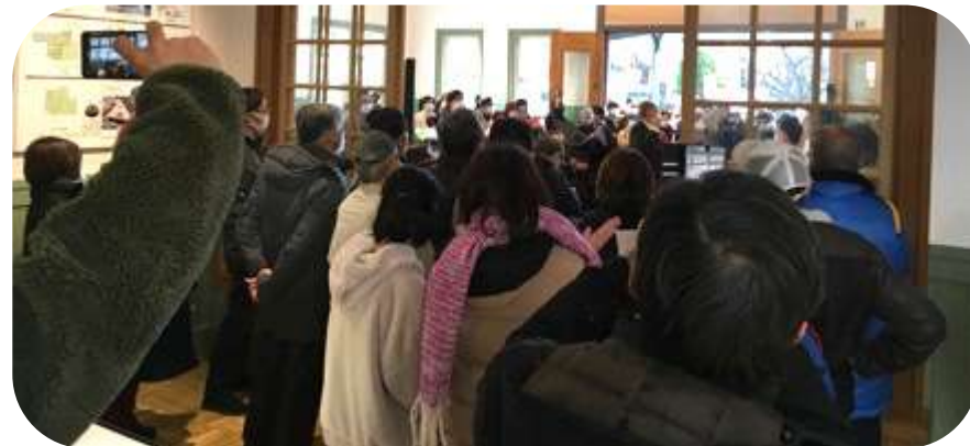
開催中の様子から

スペース) 広間 会 期) 12月19日 (日) 午後3時～ 主 催) 東京メトロチャーチ | ゴスペルクワイア