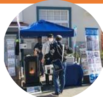
ニッポー設備さん