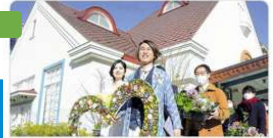
yomiuri.co.jp 旧国立駅舎で結婚式を イベント団体が初開催 「街の良さ知る機会に」！ 「旧国立駅舎」で挙式しませんか〜。国立市で活動するイベント団体が、 結婚式を地域活性化につなげる取り組みを始めた。1月には、モデルケー...