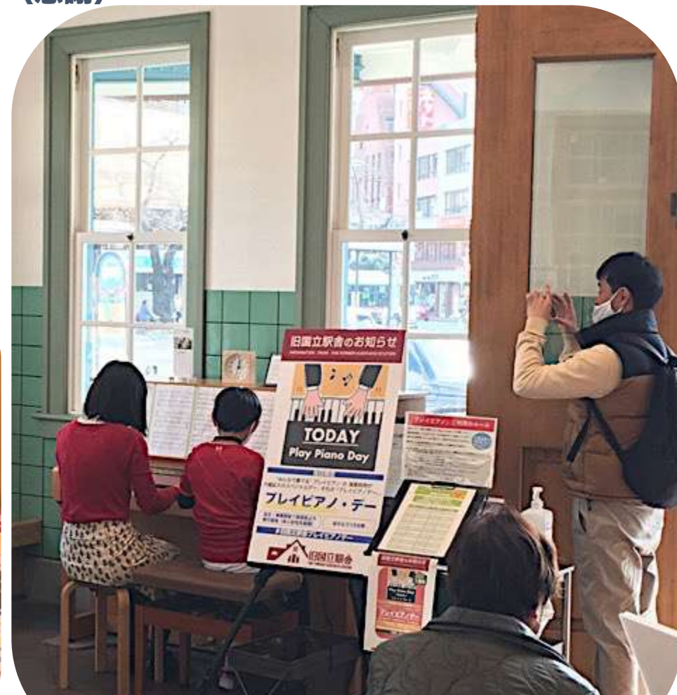
開催中の様子から