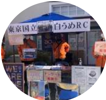
東京国立白うめロータリークラブ