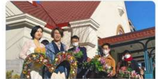
tokyo-np.co.jp 街の人と祝う結婚式 旧国立駅舎 通行人も参加：東京新聞 TOKYO Web カップルの特別な一日を街の人たちと一緒に祝おう。レトロな外観で敷 まれている国立市の旧国立駅舎で一月、そんなコンセプトの結婚式が初め...