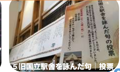
⑤旧国立駅舎を詠んだ句 | 投票