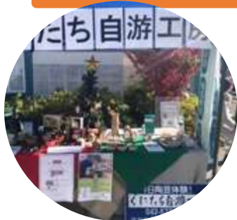
くにとち自游工房さん