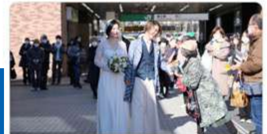
tachikawa.keizai.biz 旧国立駅舎で初めての結婚式 街のみんなでお祝い、ライブ配信も 旧国立駅舎(国立市東1)で1月22日、結婚式が行われた。