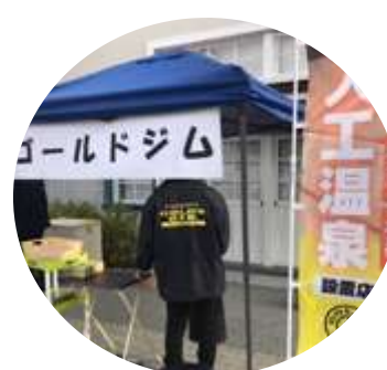
ゴールドジム国立東京さん