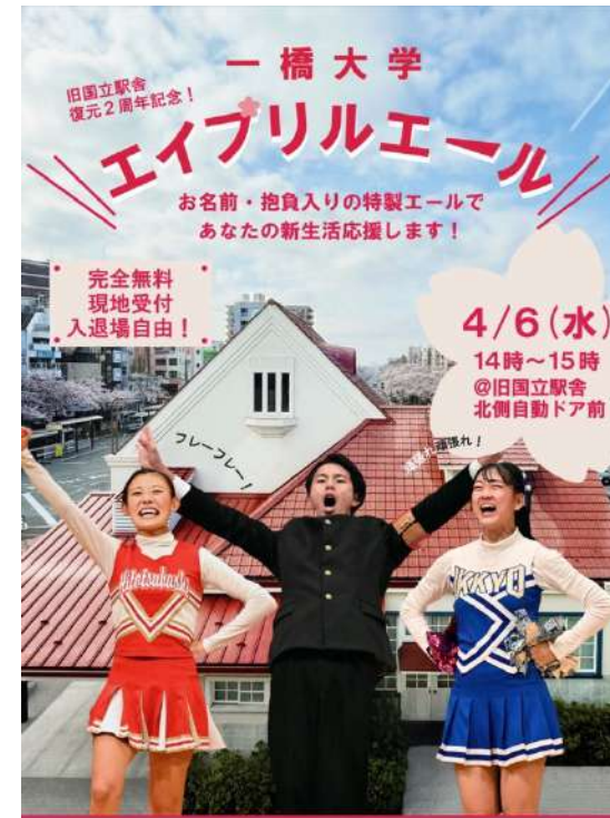
お問い合わせ：文部省からの費用許可の下、マスク・消毒液・出席者の体調管理を徹底する等感染対策に気を付け実施いたします。ご来場いただく皆様も手動ではございますがマスクをご着用の上、即座を後も御観覧いただけますよう、よろしくお願いいたします。 出演：一橋大学体育会 応援部