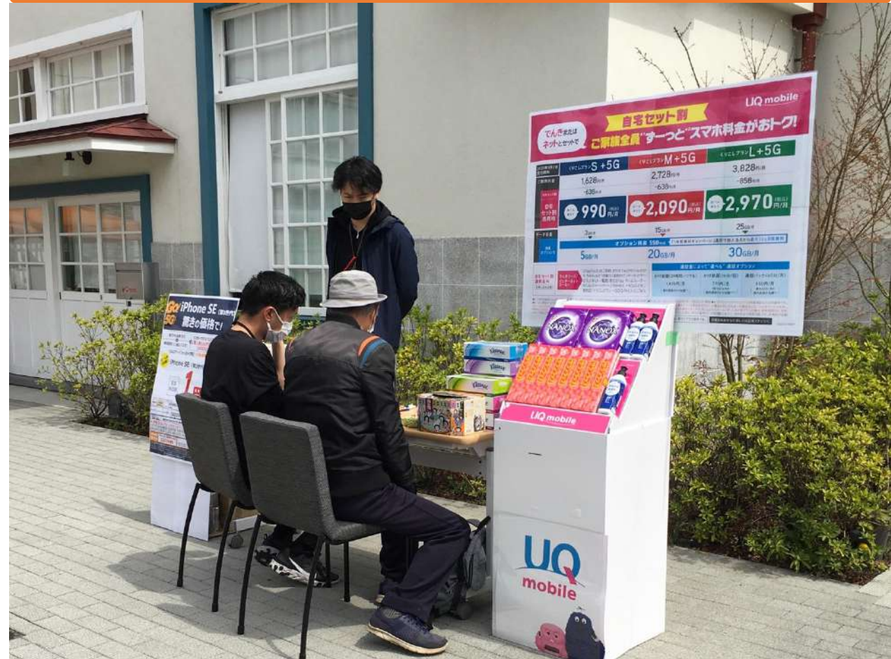
展開中の様子から