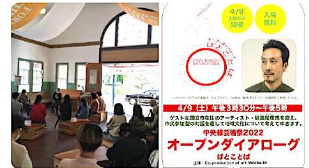
オープンダイアログ (対話) ばとことば