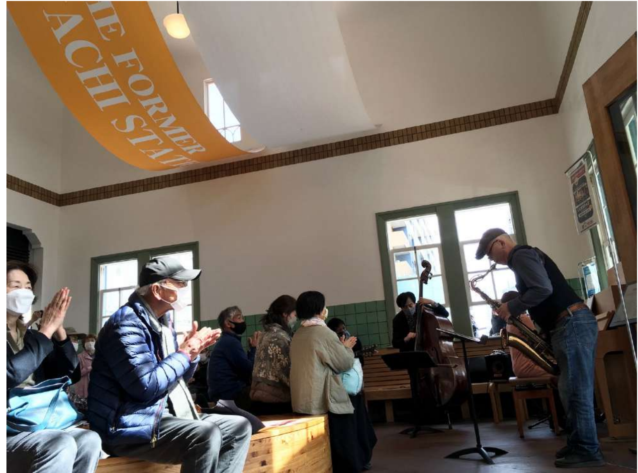
展開中の様子から