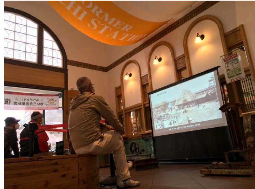
展開中の様子から

スペース) 広間 会期) 3/28 (月) - 4/2 (土) 主催) 旧国立駅舎