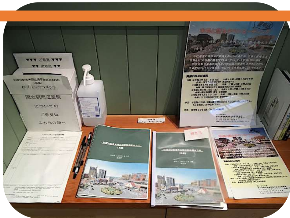
展開中の様子から

スペース) 展示室 | 資料室コーナー 会 期) 3/22 (火) - 4/12 (火) 主 催) 国立市 国立駅周辺整備課