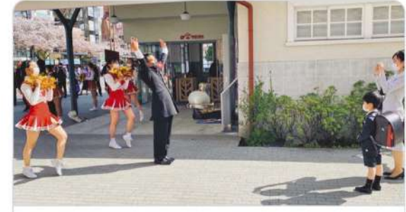
tokyo-np.co.jp 旧国立駅舎前で一橋大応援部が市民の新生活にエール：東京新聞 TOKYO ... 地域住民の新生活を応援しようと、一橋大体育会応援部が六日、国立市の旧国立駅舎前で特別パフォーマンスを披露した。「エイプリルエール」と...