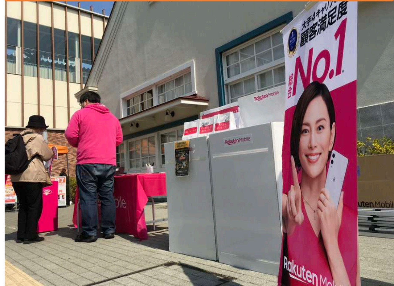
展開中の様子から