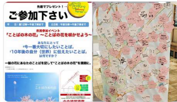
参加型アート「ことばの木の花」 “大切にしたいことば”は何ですか？