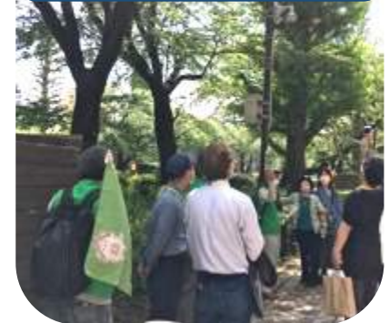
くにたち観光案内人による 大学通り 散歩ツアー