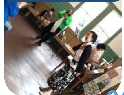
観光案内人+ ゲストによる ミニコンサート