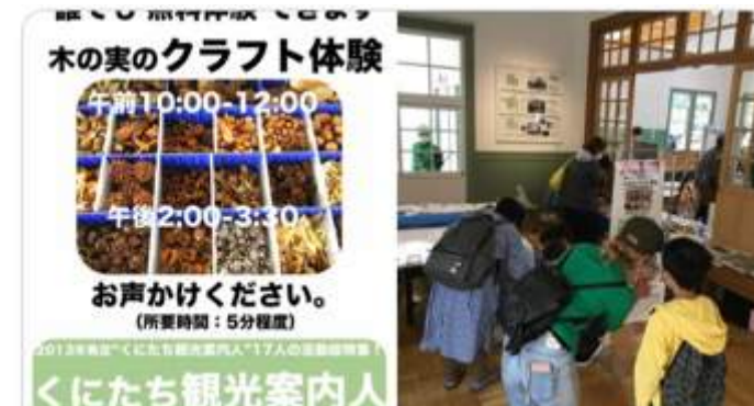
森林インストラクター資格を持つ観光案内人による 木の実のクラフト体験