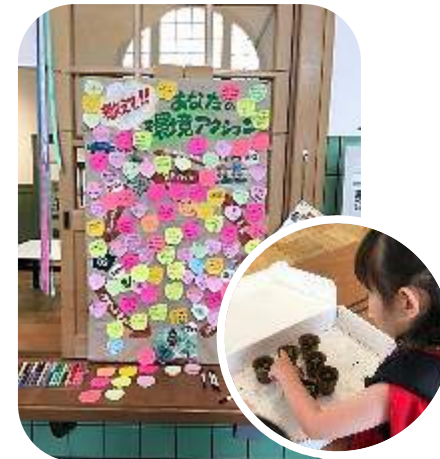
参加型ワークショップ 聞かせてあなたの環境アクション (広間 | 円形ベンチ前)