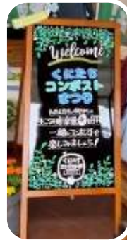
体験デモ バッグ型 | コンポスト体験 (広間 | 特設カウンター)