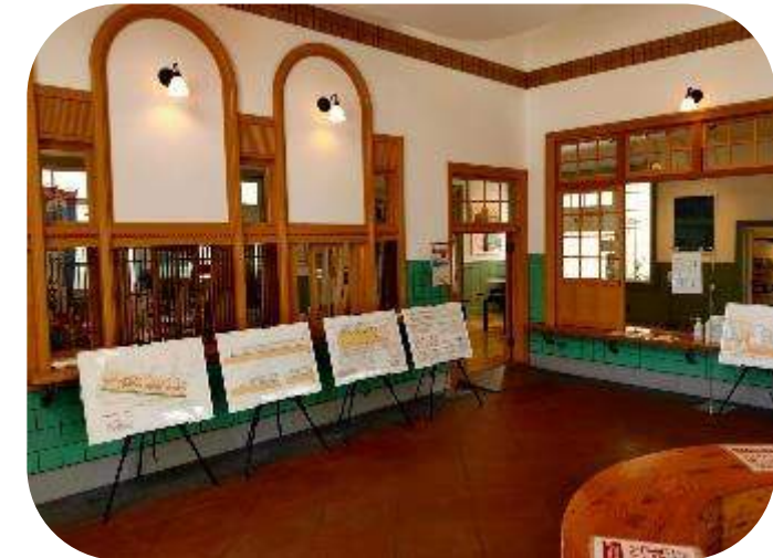
展開中の様子から