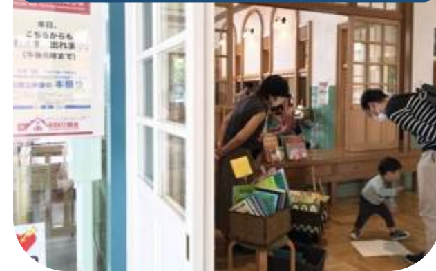
通常閉め切りの北側扉を今日だけ特別開放 展示室