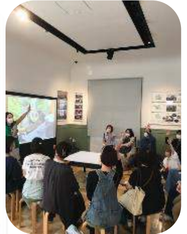
デモ&トークショー ガーデンファームきたじまさんに 堆肥を見てもらおう&質問コーナー