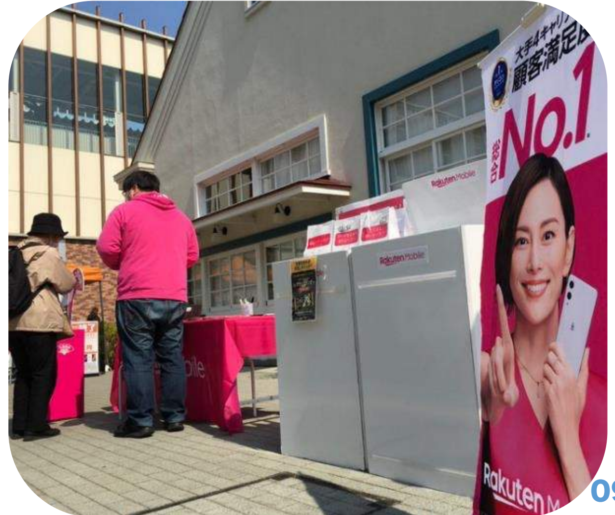
展開中の様子から

スペース) 屋外スペース「デッキ2」 会 期) 5/13 (金) ~5/15 (日) 主 催) 楽天モバイル国立