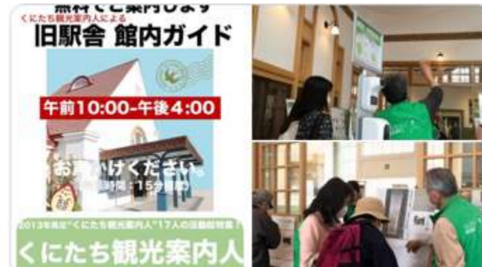
くにたち観光案内人による 国立駅舎 館内ガイド