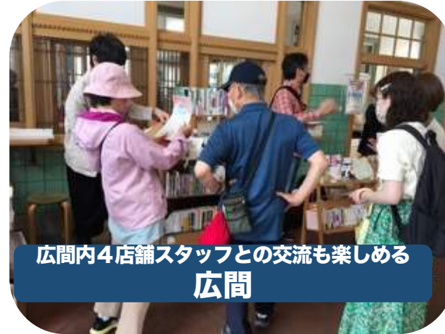
広間内4店舗スタッフとの交流も楽しめる 広間