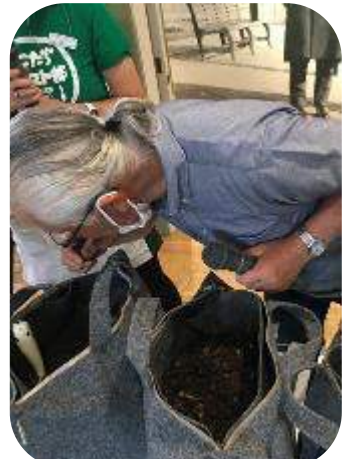
プレゼンテーション LFCコンポスト アンバサダー活動報告会