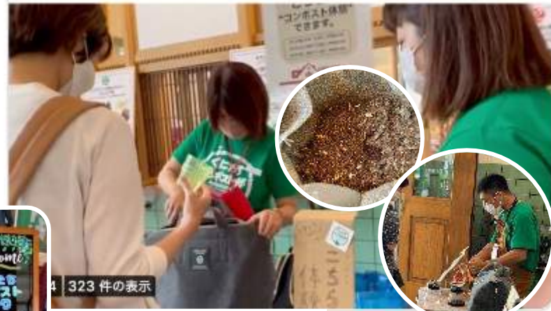
体験デモ バッグ型 | コンポスト体験 (広間 | 特設カウンター)

スペース) 広間+展示室 会期) 6/3 (金) -5 (日) 主催) くにたちコンポスト部