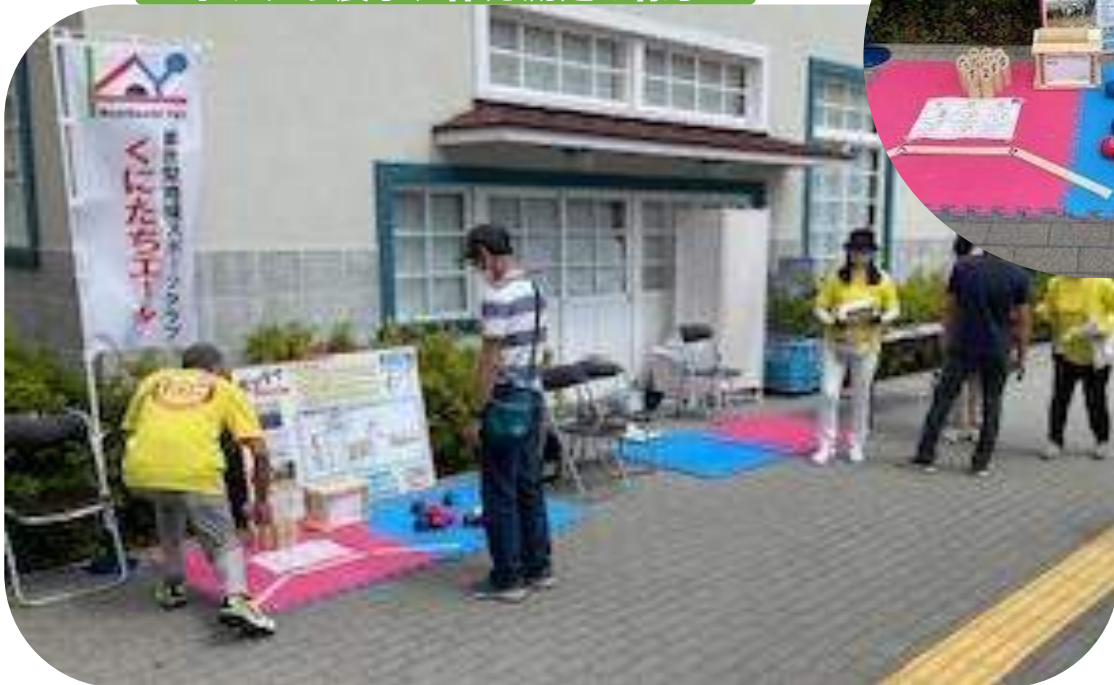
ボッチャ展示、体力測定の様子