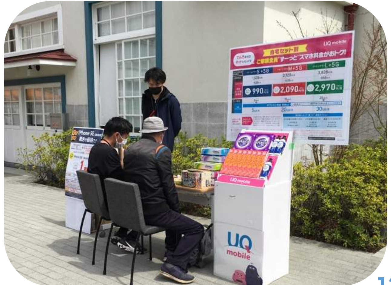
展開中の様子から

スペース) 屋外スペース「デッキ2」 会 期) 5/19 (木) - 5/22 (日) 主 催) au 国立ショップ