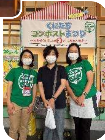
フォトスポット (広間 | 展示室前戸)