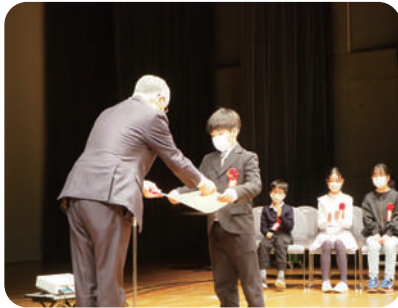
▲子ども部門の表彰式の様子