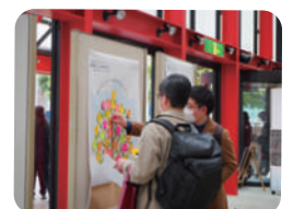
▲入り口に掲示したウィッシュツリー

優秀作品やイベントへの感想を付箋に書いていただき、会場の入り口に掲示したウィッシュツリーに貼っていただきました。