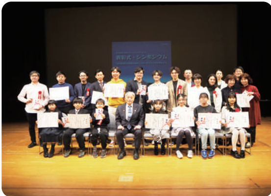
▲デザインアイデアコンペ受賞者の集合写真