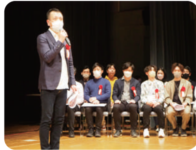
▲一般部門の表彰式の様子

応募作品 291 作品の中から優秀作品となった、子ども部門 9 作品、大人部門 9 作品の、計 18 作品を紹介します。優秀作品については、4月に旧国立駅舎で優秀作品展を実施する予定です（時期詳細未定）。また、優秀作品以外にも多くの素敵なアイデアをいただきました。多くのご応募、本当にありがとうございました！