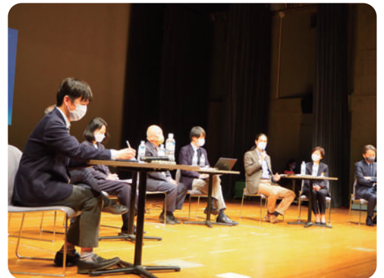
▲シンポジウムの様子

デザインアイデアコンペが終わったら、あとは市に任せるのではなく、国立市民やまちに関わる人を巻き込みながら国立駅前の整備が実現できるよう進めていけると良い。