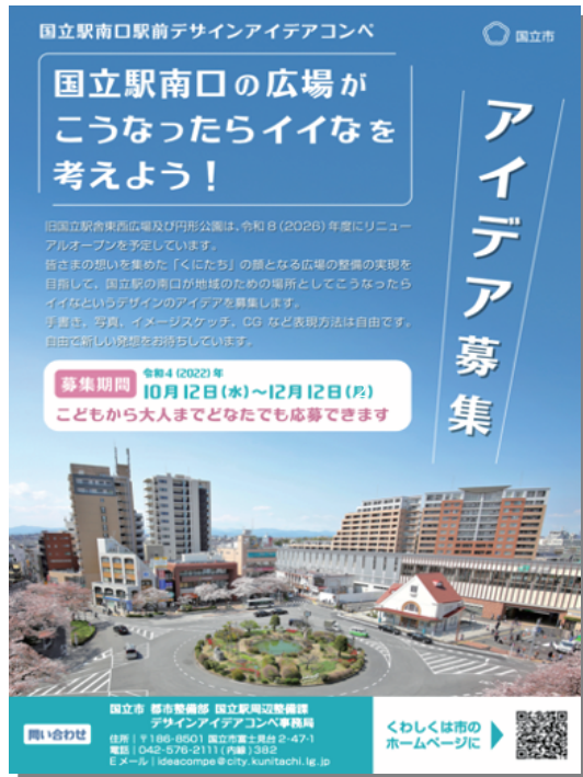
▲国立駅南口駅前デザインアイデアコンペポスター

旧国立駅舎の東西広場・円形公園含む国立駅南口駅前のデザインアイデアを募集しています。今回のコンペは、国立駅南口駅前のまちづくりの取組を皆さまに知っていただくとともに、いただいたアイデアを、次年度以降の東西広場・円形公園の設計・施工事業者選定に活かしていきます。