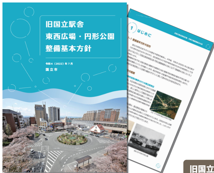
▲今後の方向性を示す整備基本方針