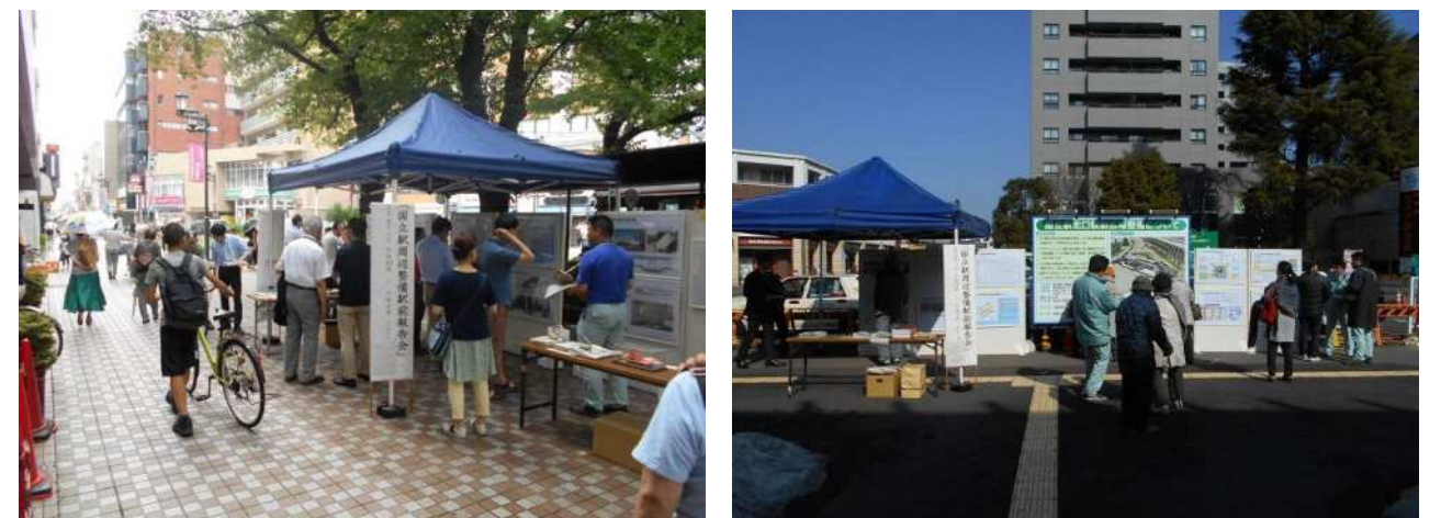
写真は、国立駅周辺整備の際に実施したオープンハウスの様子です。

今後、地区計画(素案)を作成しましたら、地区の皆様から意見募集を行います。(4頁参照)