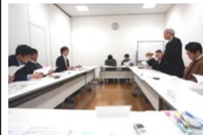
自己紹介、名刺交換など交流中

当日は7社11名の指定企業の皆様が出席され、自己紹介で各社の近況などをお話いただき、