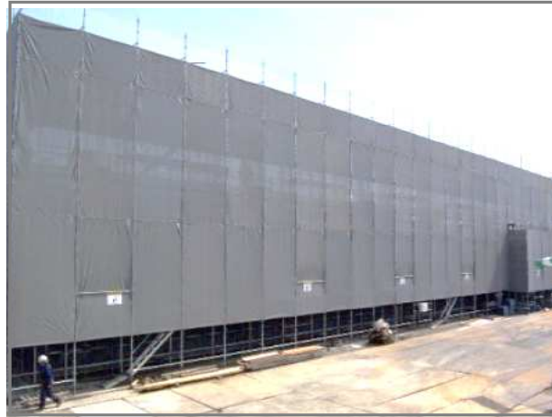
例：成形板による仮囲い(工事現場周囲に設置)