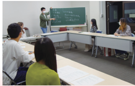
▲成人式準備会の様子

成人式の名称を「くにはたの集い」に変更します 民法の改正により、令和4年4月から成年年齢が18歳に引き下げられました。 国立市では、成年年齢引き下げ後も、引き続き20歳を対象とし、「くにはたの集い」の名称に改め実施していきます。 生涯学習課社会教育・文化財担当