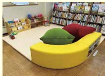
◀寝転がってリラックスしながら本に触れられるマットスペースを新たに設置しました。