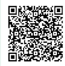
▲くにはた ちの集い準備 会募集詳細 ページ