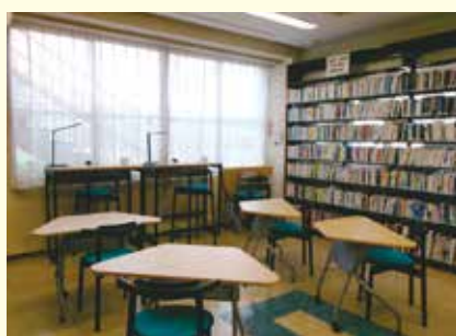
◀コーナー入口の案内掲示や、毎月10代の方へのおすすめ本を展示している棚も新しくなりました。