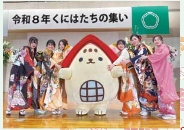
▼昨年度くにはたちの集いの様子