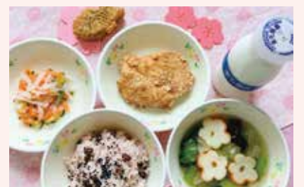
● 中学校給食・入学進級お祝い献立 鶏肉の唐揚げ