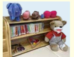
絵本にまつわるぬいぐるみも、たくさん仲間入りしました!