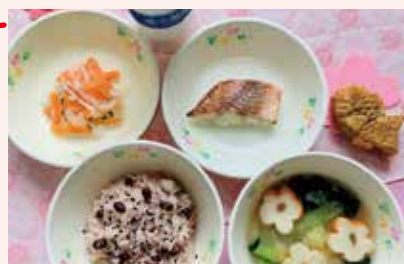
● 小学校給食・進級お祝い献立 赤魚の粕漬焼き

炊き込み赤飯(胡麻塩)・花麩味噌汁・紅白なます風サラダ・ おめでたい焼き・低温殺菌牛乳