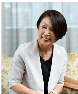
元大阪市立大空小学校 校長