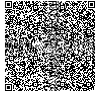
応募専用フォーム

※志望動機についての作文は、作文の内容による審査を行うものではなく、参加希望児童の動機及び意欲を確認させていただくものです。指定の文字数内でお書きください。