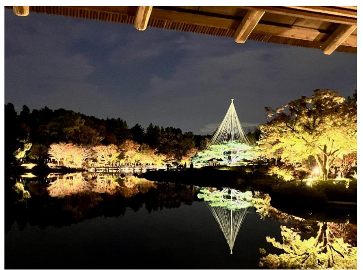
▲ライトアップされた日本庭園▲