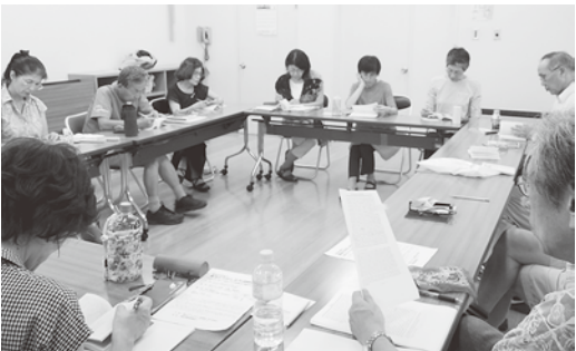
「難しくわからないね」と笑い合うのも楽しい