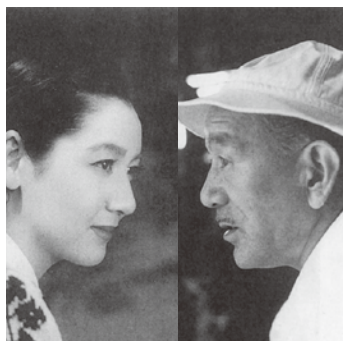
原節子、小津安二郎

先月に引き続き、日本映画の黄金時代を象徴する女優・原節子を集めた。第2弾の今回は、名コンビと謳われた名匠・小津安二郎監督との作品の中で代表作とも言える傑作『麦秋』を上映。小津安二郎の円熟の極みといえる演出、女優として絶頂期を迎えた原節子の美しさを、ぜひご堪能ください。