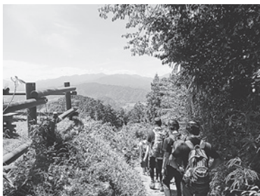
一緒に登りましょう！

初心者から始める山をコンセプトに2011年から若者で企画して、装備から山行きまでを座学とミーティング形式で学び、話し合っ山へ行きます。