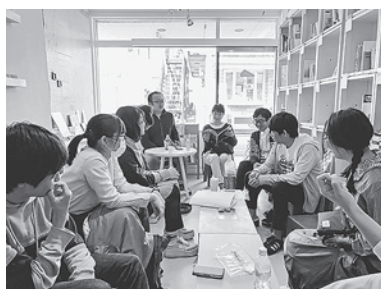
国立本店での「人生道草」の活動

の刺激やワクワクに欠けてしまいます。未知のフィールドでのコミュニケーションは一筋縄でいかないものですが、それもまた価値があるのではないのでしょうか。 活動の名前の通り、私たちの活動では道草的な価値を大切にしています。例えば「人生の道草」というインタビュー企画で、私は人生において道草だと思われることでも結果として、かけがえのないものとなるのだと知りました。道草の活動では、効率だけでは考えられない人生における枝葉の大切さを感じていただけだと思います。 私はこの活動で自分が楽しむと共に、中高生メンバーの誰かが、新しいつながりや人生における新しい見方が得られた時の喜びを知りました。中高生が地域のコミュニティに一人で足を運ぶのはハードルが高いと思います。その入り口が道草となり、その人の人生にほんの少しでも変化が起きてくれたならば私にとってこれ以上の喜びはありません。 この活動を通して、「私はこういうコミュニケーション活動が楽しい!!」と思えるようになりました。「偶然も自分が動かないと起きない。動き続けることが大事。動いて失敗することもあるけど、何かが生まれた時の価値は大きい。」そんなふう