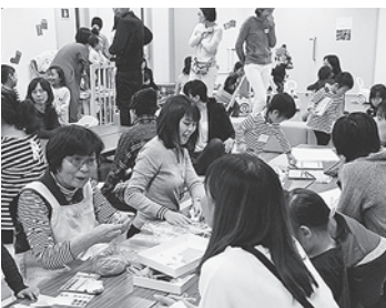
色んな世代が楽しくご飯を食べています

新型コロナウイルスはこの光景を一変させました。人と語り合いたくしながら食べるといふ、人間らしい欲求を満たすことを難しくしました。それでも6月の小・中学校で配られた緊急の食堂マップには、9つの食堂が掲載されています。多くはくにペディアに登場する食堂です。家庭・学校に加え、色んな人とご飯を食べるなかで自分合う空間を見つけ、そこをもう一