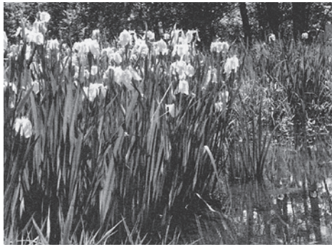
花菖蒲(矢川緑地)

整数の不思議な性質を御紹介します。何気なく見過ごしている数に思いがけない性質のあることが分かります。どなたでも気軽にお越し下さい。参加の方はお電話を。 日時 8月8日(土)22日(土)昼1時～ 場所 公民館 集会室 連絡先 山本(572) 1028