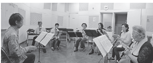
ゆったりと温かな音色♪

日時 第2、4木曜日夜7～9時 場所 公民館 音楽室 連絡先 畑(573) 0678