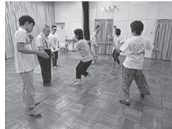
心のままに動いてみよう！

※講座を始める前の手洗い、換気、ソーシャルディスタンスをとるなど、安心して参加できる形で進めます。