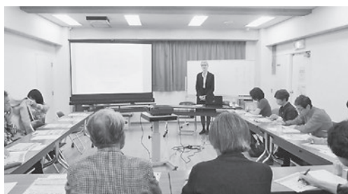
18歳で実家を出るのがフィンランド流

日本では待機児童問題をはじめ、子育て支援の改善が問題とされるなか、シルックさんから出るフィンランドの子育てのお話は、どれも驚きでした。なかでも印象に残っているのが、子どもが生まれたときに国から支給されるといいう子育てグッズが詰まったボックス。赤ちゃん用の布団、エプロン、おもちゃ、絵本、寒い国・フィンランドで不可欠なスノースーツなど、子どもが生まれてからの1年間に必要なもの一式が入っていて、ボックス自体もそのままベビーベッドとして利用できるそう。子どもは家族だけでなく、社会と一緒に育てていくのだと感じました。一方で、社会が担う部分が大きいかから、フィンランドでは子どもが自立してからの親子の関係はサラリとしているといます。社会が支えてくれる範囲の大きさに感激する一方、大学に通うなど親に支えてもらう部分が大きかった自分としては、それにより芽生えた両親への感謝や尊敬の気持ちも尊いと感じま