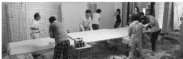
展示用パネルにペンキを塗りながらワイワイと…。