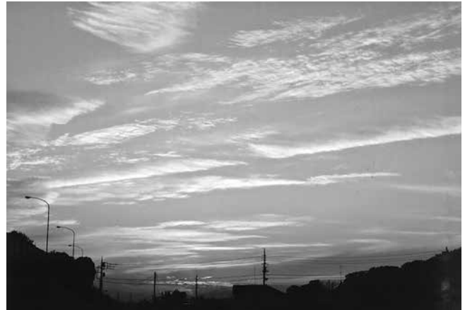
夕焼け小焼け・・・