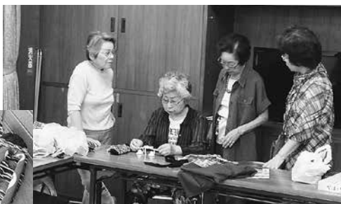
今日は布草履を作りましょう