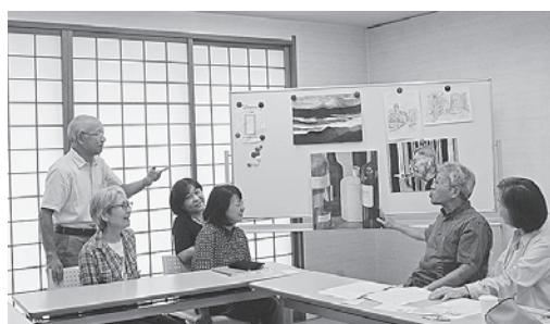
基本的には褒める!

一人ひとりが自由に描いている最中も、和やかな雰囲気でおしゃべりしたり、冗談が飛び交ったりで本当に楽しそう。また各自得た知識や学んだことを共有しあうことで、刺激になっているそう。出来上がった作品は、どれも個性