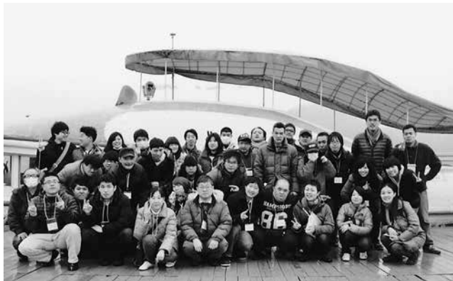
3月はみんなで合宿へ行きました(相模湖にて)

※コースの参加人数にはそれぞれ定員がありますので、ご希望にそえない場合もあります。