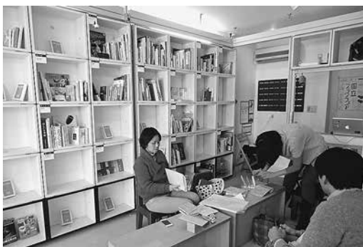
本を仲立ちに、街を編集する

連絡先 国立本店 (575) 9428 〒186-0004 国立市中1-7-62 火曜日を除く13時〜18時 〈文・写真 島本優子〉