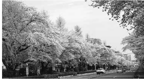
爛漫に咲き誇る (2010年) (東)