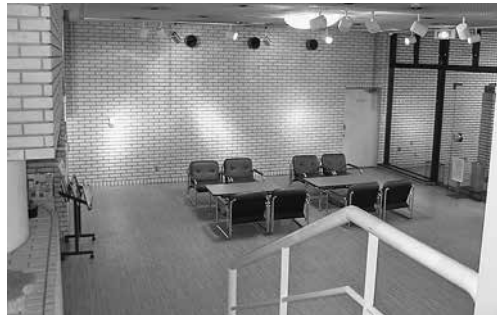
ちょっと一休みにどうぞ

グループの集まりの前後や合間に休憩することができます。またグループの展示会などに利用することもできます。