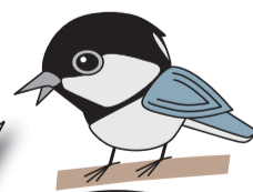
市の鳥 シジュウカラ