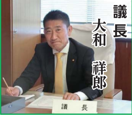
透明性のある分かり易い議会運営を目指して

この度の臨時会において議長に選任され重責を痛感しております。市民の皆さまに信頼いただける議会を目指し、開かれた議会の為、公平性及び透明性を重視し、更なる議会改革を行って参ります。安心安全なまちづくりと住民福祉の増進の為、高齢者問題から次代を担う子ども達までの支援を行って参ります。