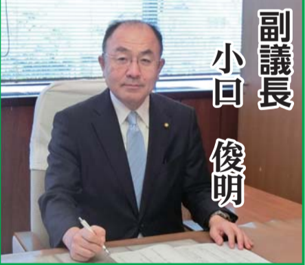
品位を守り信頼される市議会を構築します

さきの臨時会におきまして、副議長に就任いたしました。議長を補佐し、市民の皆さまのご期待にこたえるべく、職務を全うしてまいります所存です。国立市議会の品位を守り、信頼される議会としていくために力を尽くしてまいります決意を申し上げ挨拶とさせていただきます。