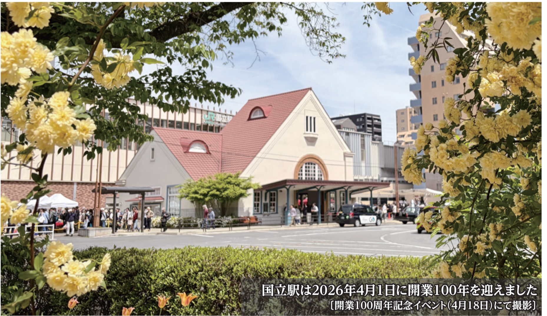
国立駅は2026年4月1日に開業100年を迎えました [開業100周年記念イベント(4月18日)にて撮影]