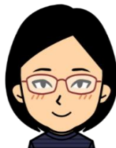
谷相談員(もいもい)